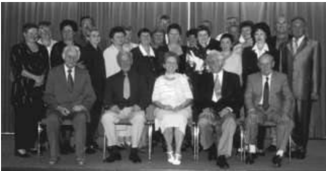
Foto von dem Klassentreffen des Jahrgangs 1950 vor 20 Jahren.

Anmerkung der Redaktion: Gerne machen wir Werbung für Klassentreffen und wünschen uns auch, dass wir über diese in den nächsten Heftausgaben berichten können. Im Rahmen der letzten Engelsbrunner Treffen haben wir versucht auch Klassentreffen für einige Jahrgänge zu integrieren. Leider ist das nicht in dem Maße gelungen, wie wir uns das vorgestellt haben. Es wäre wünschenswert, wenn die Klassentreffen nicht ein Ersatz, sondern eine Ergänzung zum Engelsbrunner Treffen sein würden, und wenn bei diesen Jahrgangstreffen auch Werbung für das Engelsbrunner Treffen gemacht werden könnte, um die Engelsbrunner Gemeinschaft zu stärken. Wir werden immer weniger, einige von uns sind nicht mehr mobil genug, und die Gemeinschaft kann nur am Leben gehalten werden, wenn alle gemeinsam an einem Strang ziehen.