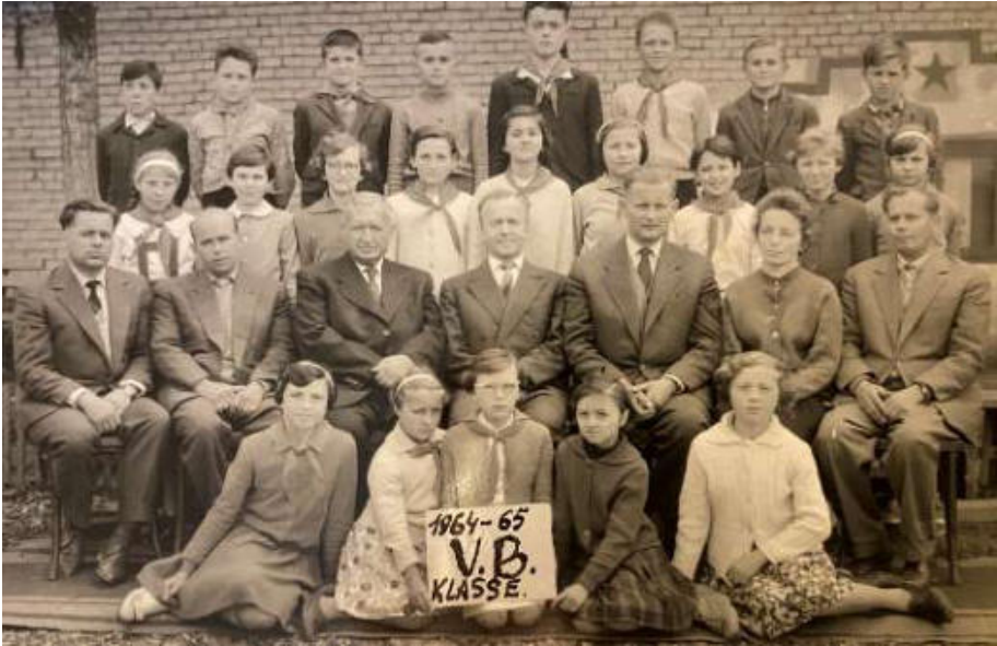
Jahrgang 1953

Anmerkung der Redaktion: Gerne machen wir Werbung für Klassentreffen und wünschen uns auch, dass wir über diese in den nächsten Heftausgaben berichten können. Im Rahmen der letzten Engelsbrunner Treffen haben wir versucht auch Klassentreffen für einige Jahrgänge zu integrieren. Leider ist das nicht in dem Maße gelungen, wie wir uns das vorgestellt haben. Es wäre wünschenswert, wenn die Klassentreffen nicht ein Ersatz, sondern eine Ergänzung zum Engelsbrunner Treffen sein würden, und wenn bei diesen Jahrgangstreffen auch Werbung für das Engelsbrunner Treffen gemacht werden könnte, um die Engelsbrunner Gemeinschaft zu stärken. Wir werden immer weniger, einige von uns sind nicht mehr mobil genug, und die Gemeinschaft kann nur am Leben gehalten werden, wenn alle gemeinsam an einem Strang ziehen.