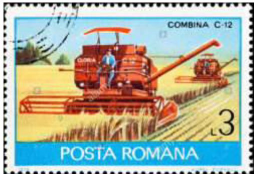
Der Gloria C12 wurde sogar eine Briefmarke gewidmet