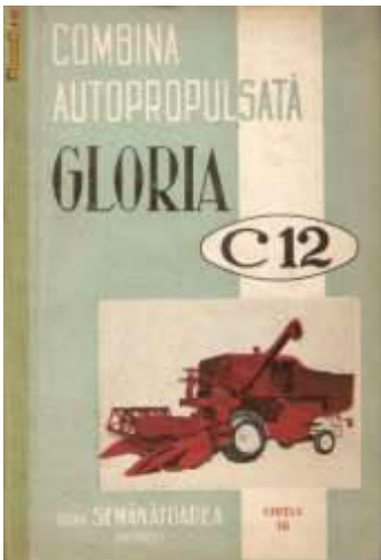
Handbuch Mährescher Gloria C12