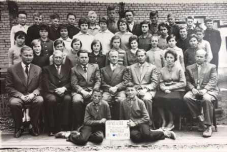
Jahrgang 1952