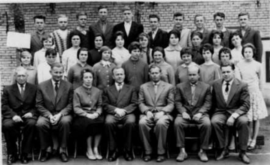
Jahrgang 1950