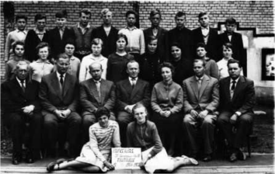
Jahrgang 1951 (Foto von Peter Titsch)